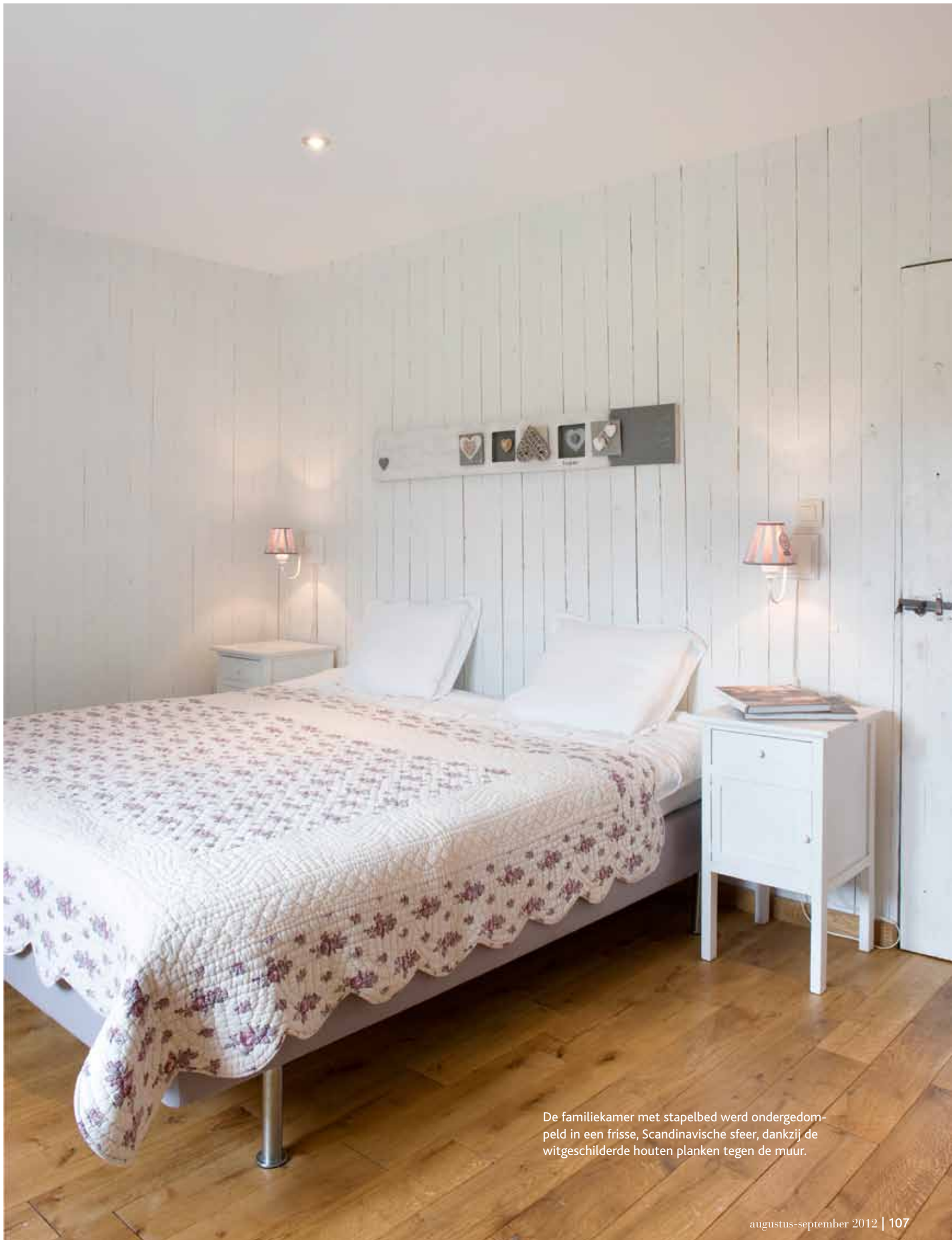
De familiekamer met stapelbed werd ondergedompeld in een frisse, Scandinavische sfeer, dankzij de witgeschilderde houten planken tegen de muur.